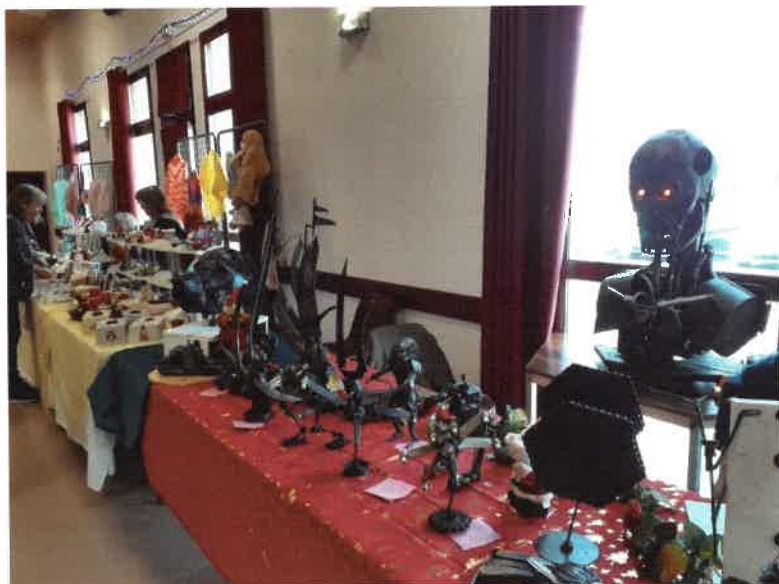
Marché de Noël 2024

Pour cela l'Association compte aussi sur l'arrivée de nouveaux membres. Au contact des anciens, les plus jeunes qui sont sensibles au travail manuel, à l'appropriation du bois et du métal sont les bienvenus. Des perspectives nouvelles vont s'ouvrir afin de faire évoluer Le Musée pour le plaisir de tous.