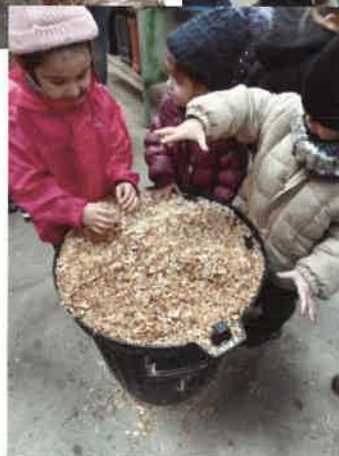
En visite à l'ébénisterie Poulard