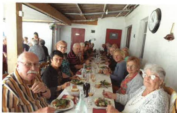
Repas, voyages, ... de bons moments partagés avec les amis du club.