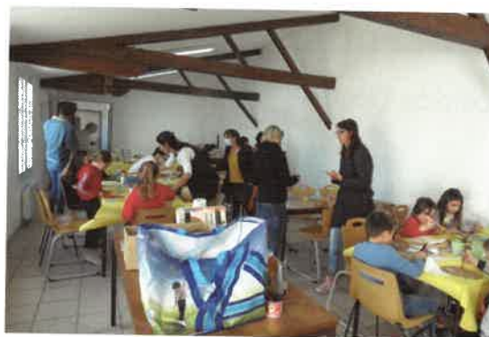
Activité créative avec les enfants et l'APE en 2022

Prix : 250 F. Inscriptions jusqu'au 30 Avril 96.