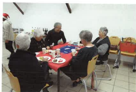
Pendant les réunions on tapait le carton !