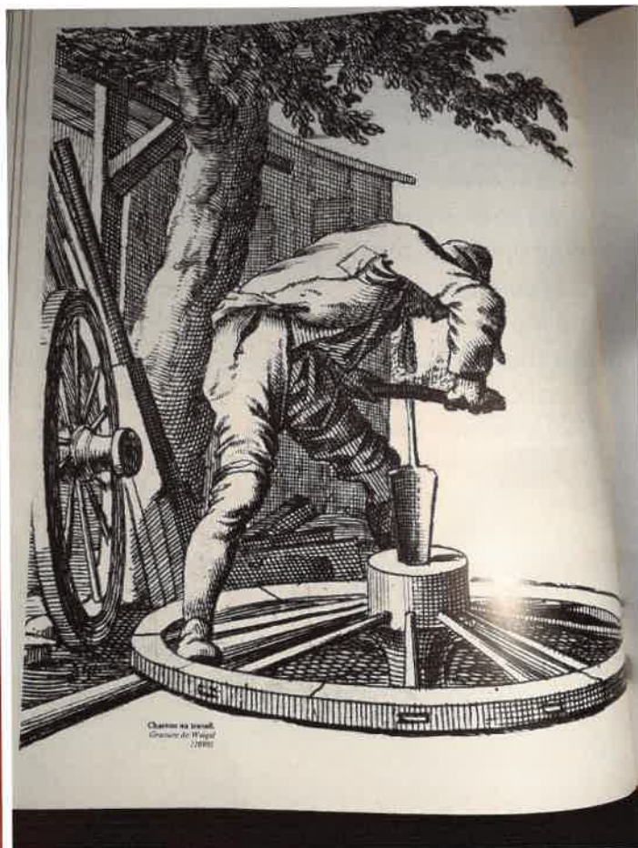
Bibliothèque du Musée : Gravure du charron