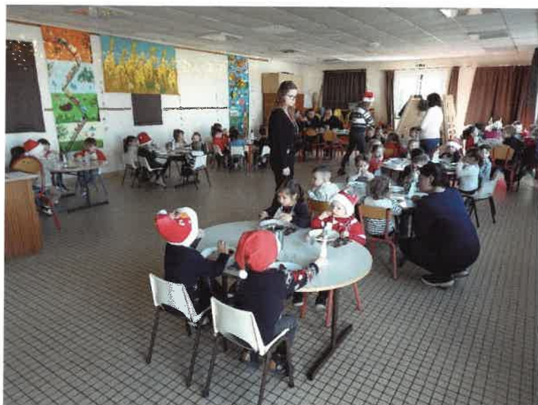
Jour de Noël à l'école !